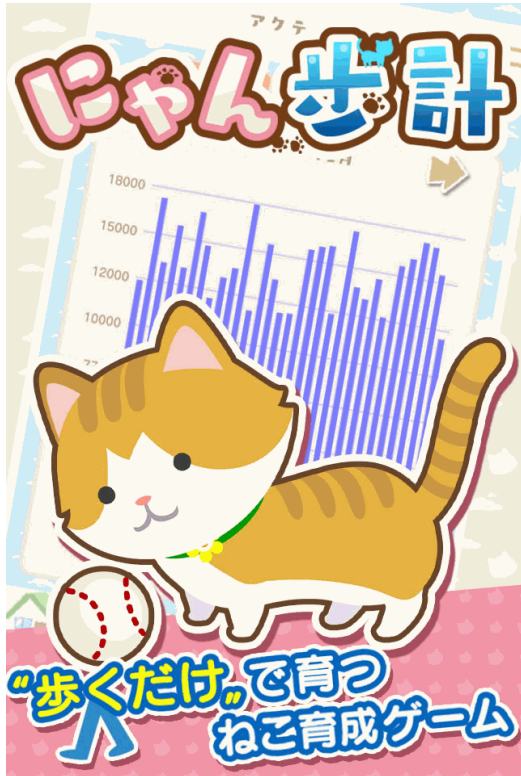
歩数計付きのねこ育成ゲーム「にゃん歩計」 (スマートフォンアプリ)