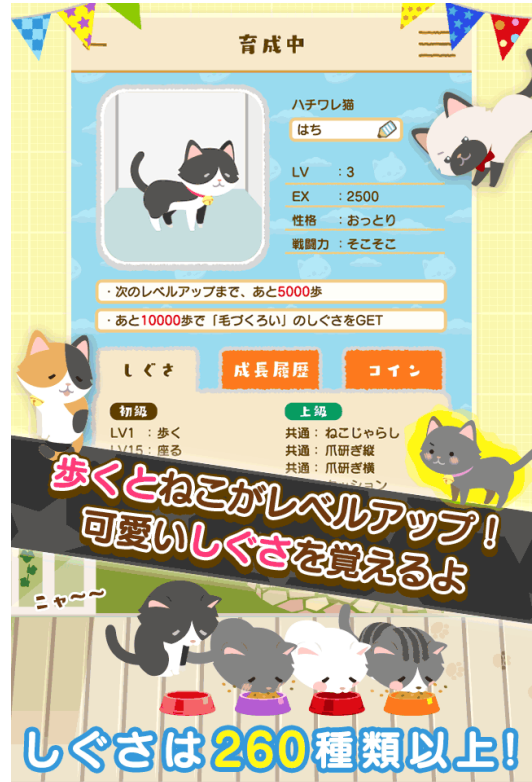
歩くと、ねこがレベルアップして 260種類以上の可愛いしぐさを覚えます